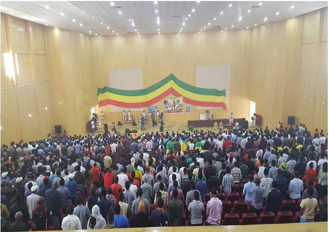
ሐምሌ 5 2008 ዓ.ም በአማራ ሕዝብ ላይ የተቃጣ ጥቃት የተመከተበት ቀን በጎንደር ከተማ እንዲህ ታስቦ ውሏል!! July 12 2018