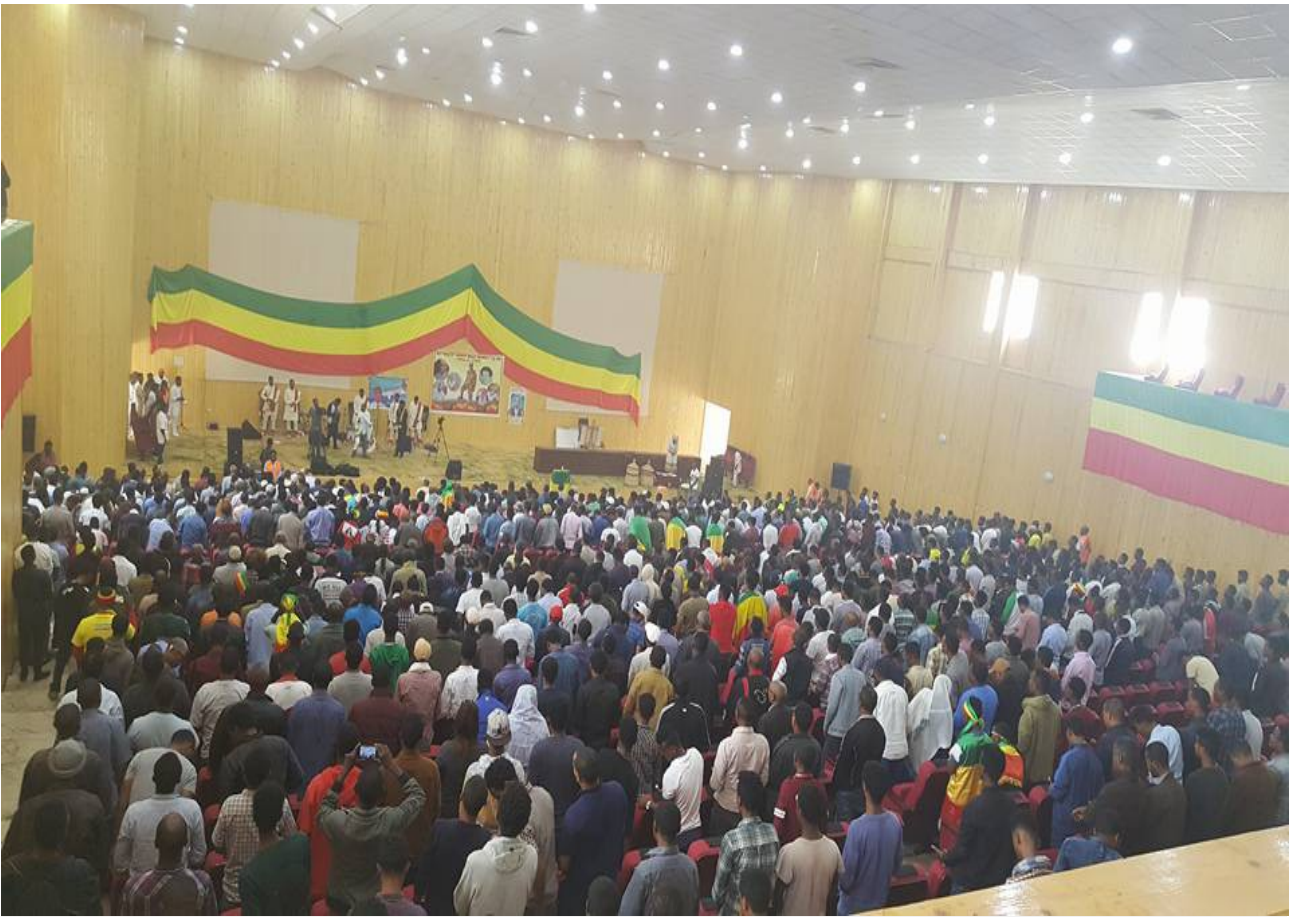
ሐምሌ 5 2008 ዓ.ም በአማራ ሕዝብ ላይ የተቃጣ ጥቃት የተመከተበት ቀን በጎንደር ከተማ እንዲህ ታስቦ ውሏል!! July 12 2018