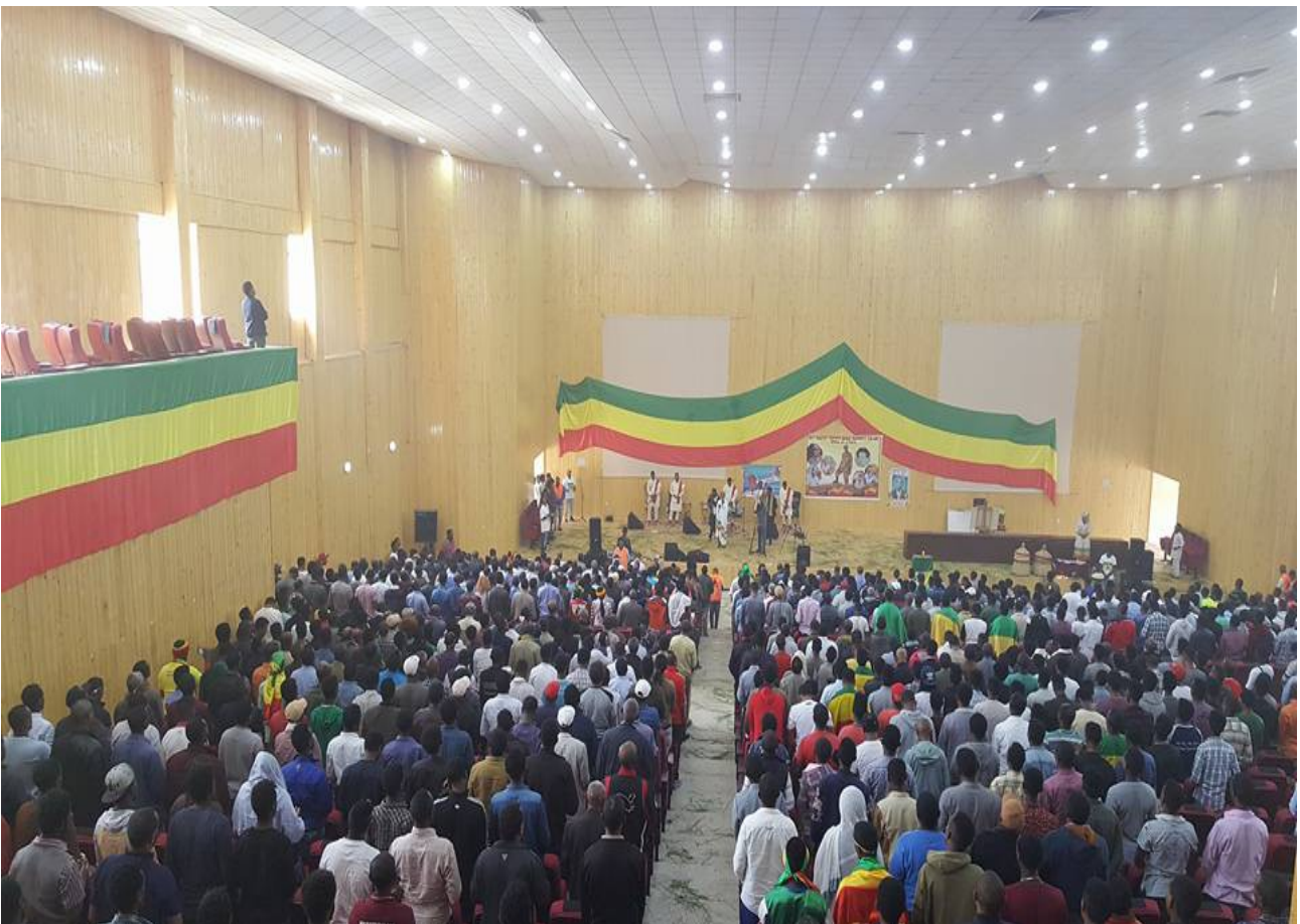
ሐምሌ 5 2008 ዓ.ም በአማራ ሕዝብ ላይ የተቃጣ ጥቃት የተመከተበት ቀን በጎንደር ከተማ እንዲህ ታስቦ ውሏል!! July 12 2018